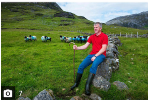
Conamara Láir Campaign

Residents hail 'unique and safe landscape'