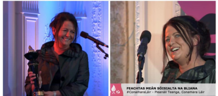
Máirín ag glacadh leis an ngradam i dTeach & Estáit Farmleigh ar an 26ú Samhain